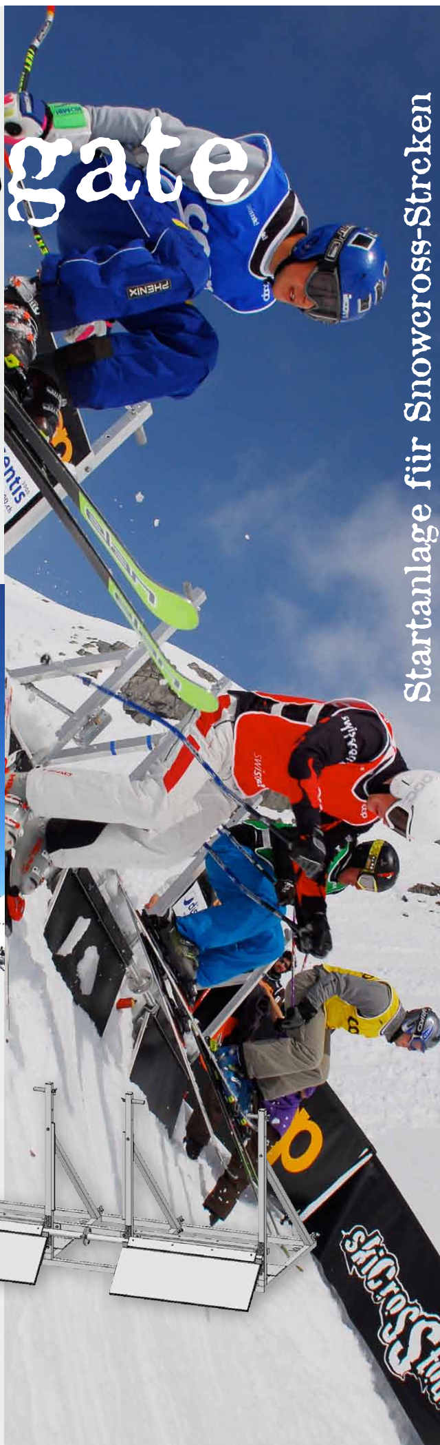
Startanlage für Snowcross-Strecken